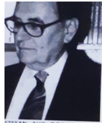
ȘTEFAN AUG. DOINAȘ

ȘTEFAN AUG. DOINAȘ (numele Ștefan Popa)-născut la le 1922 în comuna Hul(Caporal Alexa)Jud.Arad-d.la 2002,a fost poet,eseist, traducător, critic,academician și politician membru în legislația 1992/1996 ales în categori pe listele partidului Alianța