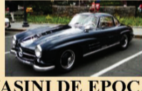
MAȘINI DE EPOCĂ