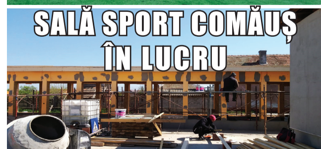
SALĂ SPORT COMĂUȘ ÎN LUCRU