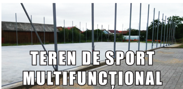
TEREN DE SPORT MULTIFUNCȚIONAL

În lipsa competițiilor sportive care ne-au adus campionii anilor trecuți, marele câștigător de anul acesta a fost infrastructura pentru sport. Construcția și modernizarea bazelor sportive din oraș este un obiectiv important al actualei administrații pentru creșterea și îmbunătățirea nivelului de trai și a stării de sănătate a cetățenilor.