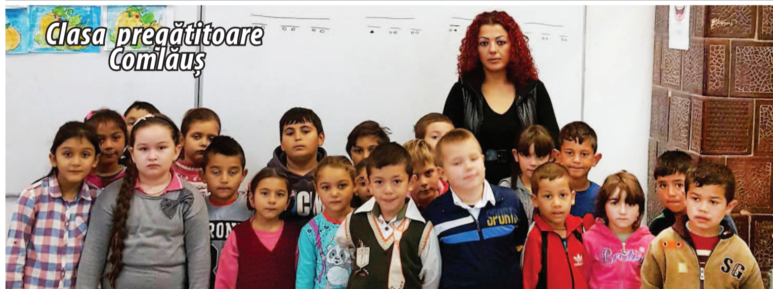
Clasa pregătitoare Comlăuș