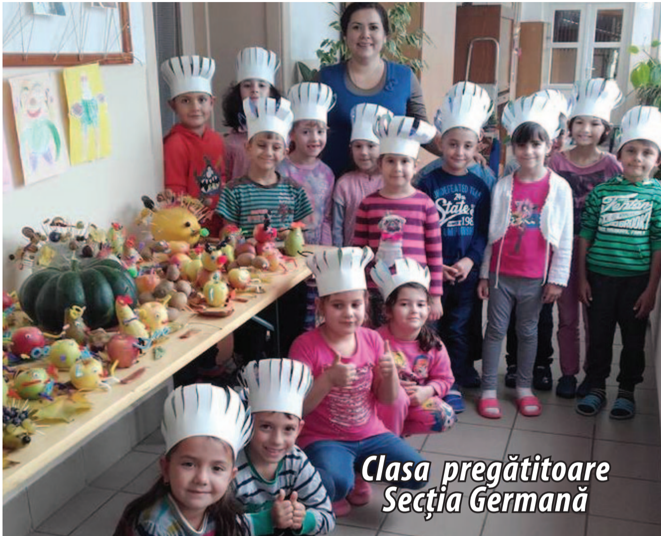
Clasa pregătitoare Secția Germană

Toamna noi am așteptat Și spre școală am plecat. Veseli suntem și cumiți Și ascultăm de părinți. În clasa noastră de veniți, Cu Minnie și Mickey vă-ntâlniți. Căci pe ei noi i-am ales, Să ne-nsoțească-n mers, Știința să o deslușim, Și educație să primim. Ne place să ne jucăm, Dar și multe să-nvățăm: