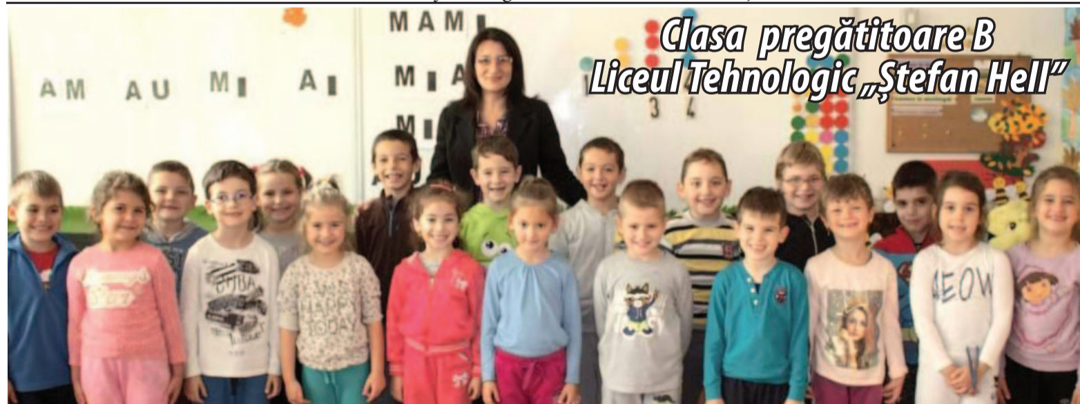
Clasa pregătitoare B Liceul Tehnologic „Ștefan Hell”