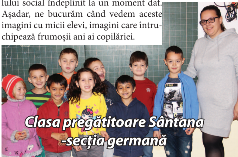
Clasa pregătitoare Sântana -secția germană

Menționăm că vă aducem în prim plan doar copiii care au fost prezenți în momentul la care am realizat fotografiile, noi urăm însă tuturor colectivelor de copii sărbători fericite și să se bucure din plin de cadourile pe care le-au primit de Crăciun.