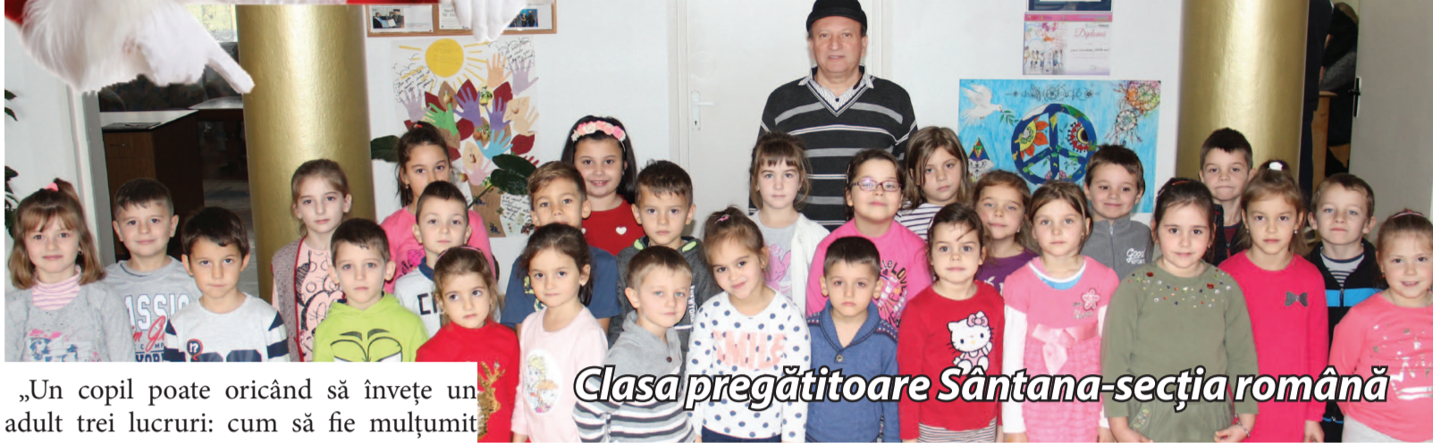
Clasa pregătitoare Sântana-secția română

Apropierea sărbătorilor de iarnă a adus nerăbdare printre copiii de la clasele pregătitoare în așteptarea darurilor mult dorite. Pentru a le afla părerile am fost și noi să stăm de vorbă cu aceștia, unde altundeva decât la Sântana și Caporal Alexa.