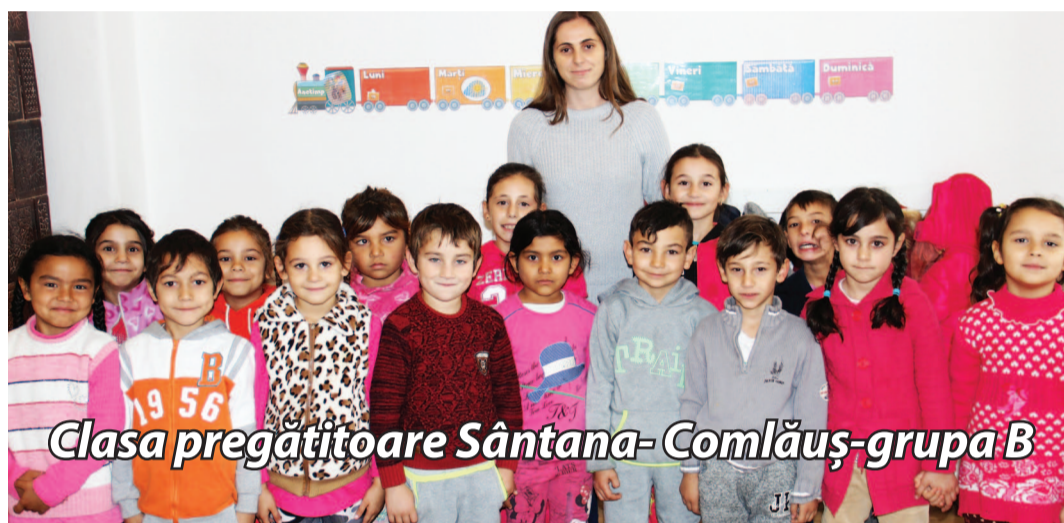
Clasa pregătitoare Sântana-Comlăuș-grupa B

Fiecare om are un ideal, un drum pe care și-l croiește sau pe care îl îndrumă cineva. Totul pornește din primii ani de viață. Copilul dorește să întruchieze omul din el. Personalitatea fiecăruia este oglindită prin ceea ce dorește, face, obține. Acceptarea diversității presupune acceptarea rolului social îndeplinit la un moment dat. Așadar, ne bucurăm când vedem aceste imagini cu micii elevi, imagini care întruchiează frumoșii ani ai copilăriei.