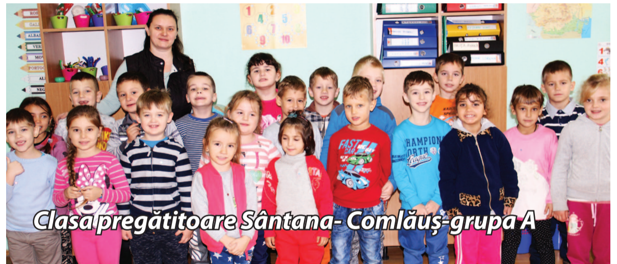
Clasa pregătitoare Sântana- Comlăuș-grupa A