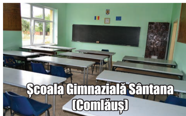
Școala Gimnazială Sântana (Comlăuș)