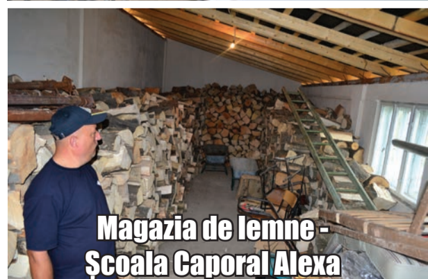
Magazia de lemne - Școala Caporal Alexa