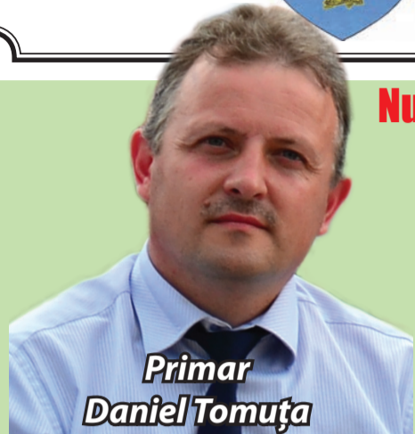
Primar Daniel Tomuța

Anul școlar 2013-2014 a început în bune condiții. Toate școlile și grădinițele de pe raza orașului nostru au fost pregătite așa cum se cere pentru primirea elevilor. Le urez deopotrivă tuturor elevilor, părinților, dascălilor, personalului administrativ al școlilor și tuturor celorlalți care sunt implicați într-un fel sau altul în procesul de învățământ, un an școlar plin de realizări și de bucurii.