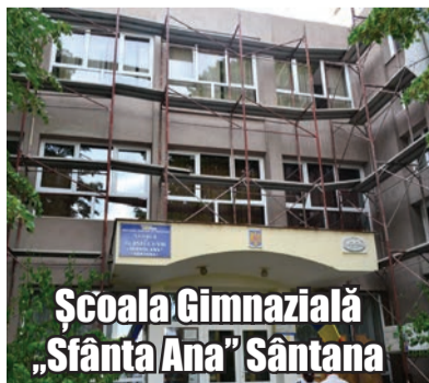
Școala Gimnazială „Sfânta Ana” Sântana

Au fost alocate sumele necesare pentru efectuarea lucrărilor de reabilitare termică și reparații acoperiș pentru clădirea principală a Liceului Tehnologic, lucrări care urmează să înceapă în această toamnă. În plus vor fi înlocuite și obiectele sanitare defecte.